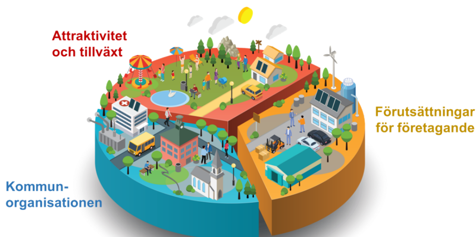
Figur 1 Visionens målområden